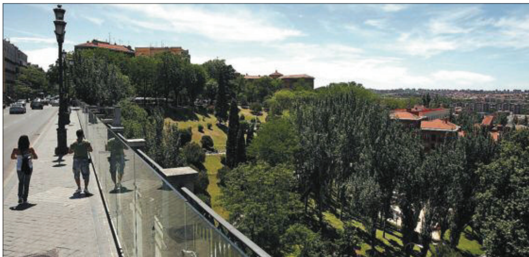
Jardines de Las Vistillas en junio de 2009, vistos desde el viaducto de la calle de Bailén.