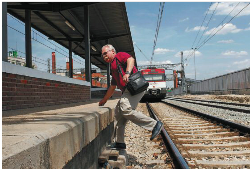
Un hombre cruza las vías del tren de la estación de Torrejón de Ardoz.