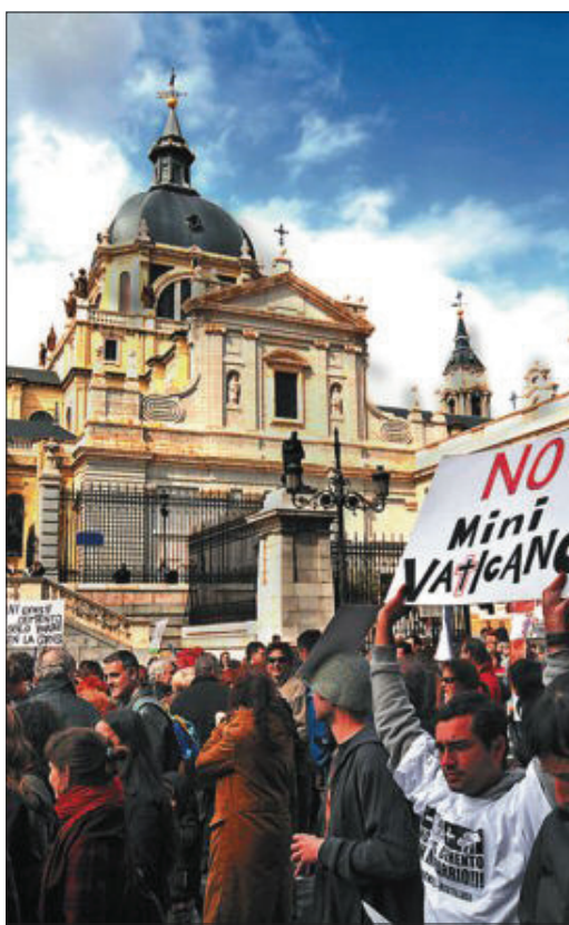
Manifestación de los vecinos de Las Vistillas en 2009.

Ruiz de Gauna achaca a "intereses electorales" toda la operación entre ambos organis-